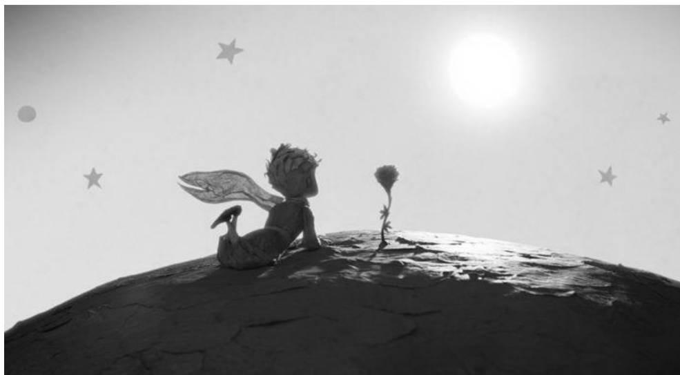
Слика 12. Мали принц и ружа

ружу, занемарујемо мане и прихватамо их јер „човек само срцем добро види” (Егзипери 1979: 59). Однос Принца и руже може да подстакне ученике на причу о љубави и пријатељству, њихово схватање тих појмова. Да ли љубав и пријатељство морају да се негују по сваку цену? Само је једно од питања на које наводи цртеж Малог принца и његове руже.