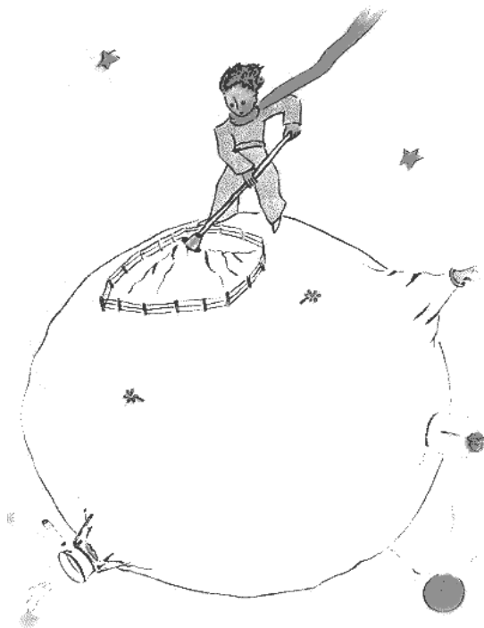
Слика 6. Мали принц уређује своју планету

На овој слици представљен је свет Малог принца, недостају његова ружа и баобаби. Слика је испричала оно што је писац записао и обрнуто – оно што је писац записао о астероиду Б 612 садржано је у тој једној слици. Малени дечак приказан је као господар те планете, али не округли господар који само влада, већ као господар који брине о својој земљи и својим поданицима. Брине о вулканима, о баобабима и пажљиво уређује своју планету. Сама чињеница да је његову планету писац поистоветио са кућом указује нам да треба да се угледамо на Малог принца и да своју планету брижљиво уређујемо и негујемо.