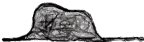
Слика 2. Змијски цар

Први цртеж у овој књизи посредно у први план истиче и основу дела – разлику између деце и одраслих.