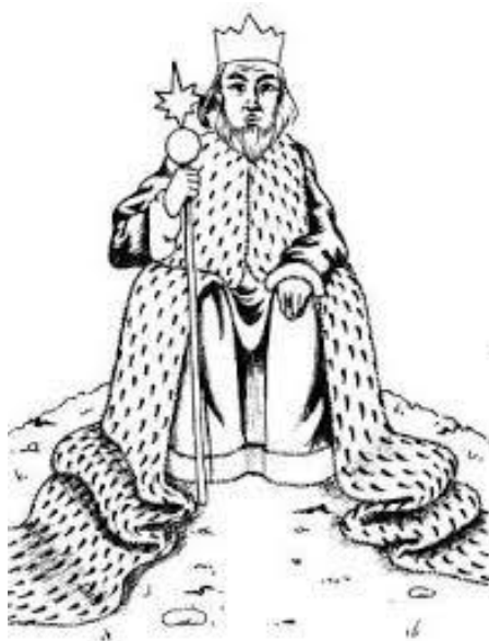
Слика 9. Краљ

На првој планети до које је дошао Мали принц становао је краљ. Краљ је био апсолутни владар, али разуман. Проблем је био што није имао поданике.