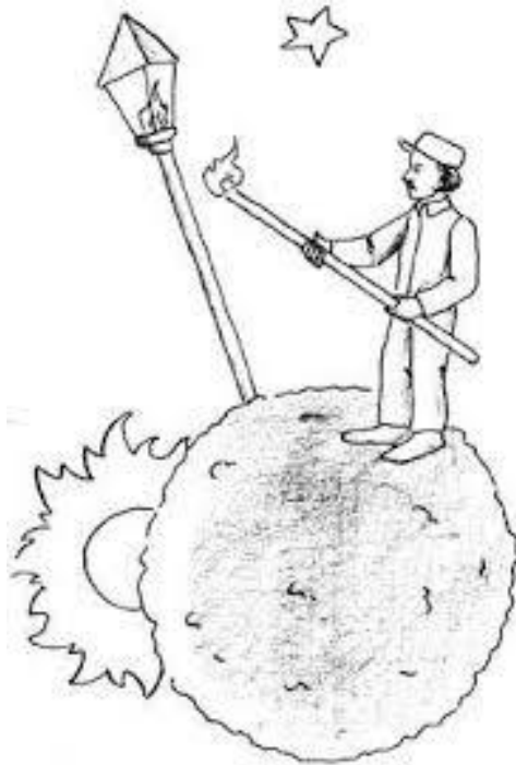
Слика 10. Фењерџија

За рад на часу наставник може да одабере било који лик и да разговара са ученицима о односу Малог принца са тим ликом. Као пример у овом раду наводи се фењерџија. Из тог сусрета ученици могу да науче понешто о посвећености и раду. Шта фењерџија ради? Да ли је тај посао узалудан? Зашто он не одустаје? Да ли би, можда, требао да одустане? Веома је битно допустити ученицима да искажу своја мишљења.