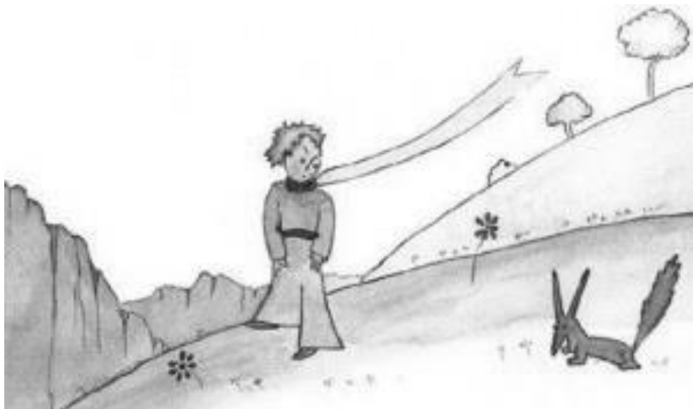
Слика 11. Мали принц и лисица

Кроз разговор са лисицом Принц схвата шта то значи бити припитомљен . Схвата да је он, још од самог почетка путовања, припитомљен и да воли своју ружу. Бити припитомљен је ствар и срца и културе и васпитања, означава спремност на компромис и прихватање других људи без осуде. Из сваког новог познанства Мали принц учи нешто ново и тако се његова личност развија.