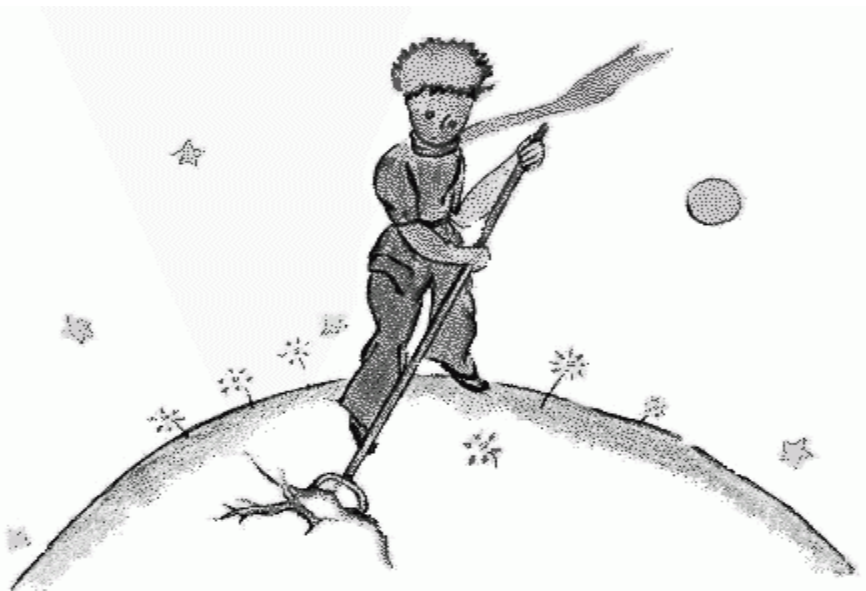
Слика 13. Мали принц уређује своју планету

Као и свака метафоричка прича и ова доноси различита тумачења. Свако од читалаца може да да своје субјективно тумачење. То је заправо лепота овог дела – свако ново читање доноси нове мисли, нова осећања и нова тумачења. Уколико редовно негујемо своје мисли, допуњујемо их позитивним размишљањима – напредоваћемо. Уколико допустимо да нас негативне мисли окупирају, прогутаће нас као велико и страшно дрвеће које прети да прогута планету Малог принца.