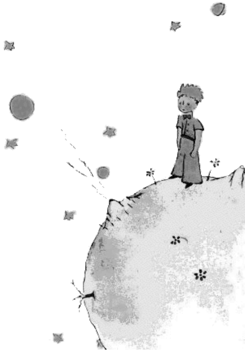
Слика 5. Мали принц на својој планети

Егзиперијев цртеж планете на којој је рођен Мали принц, планете „једва мало веће од неке куће” (Егзипери 1979: 19), астероида Б 612, препун је симболике.