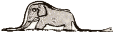
Слика 3. Змијски цар изнутра

суштину и поенту, јер „одрасле особе никада ништа не схватају саме, а децу замара да им стално дају објашњења” (Егзипери 1979: 9). Наратор је својом првом сликом желео да представи змијског цара, који је прогутао слона, али одрасли нису видели оно што је он желео да виде. Пошто су одраслим особама „увек потребна објашњења” (Егзипери 1979: 8), Мали принц је нацртао и змијског цара изнутра: