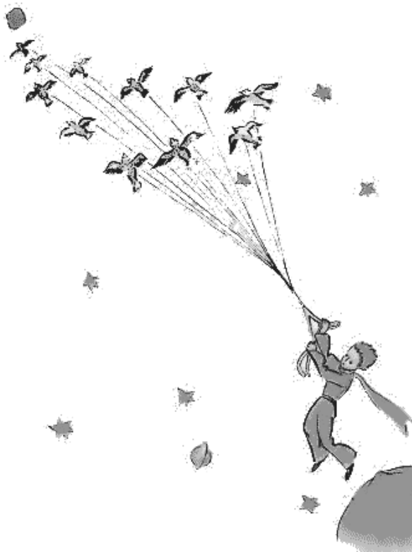
Слика 7. Одлазак Малог принца

Посебну лепоту писац је представио на слици која приказује начин путовања Малог принца.