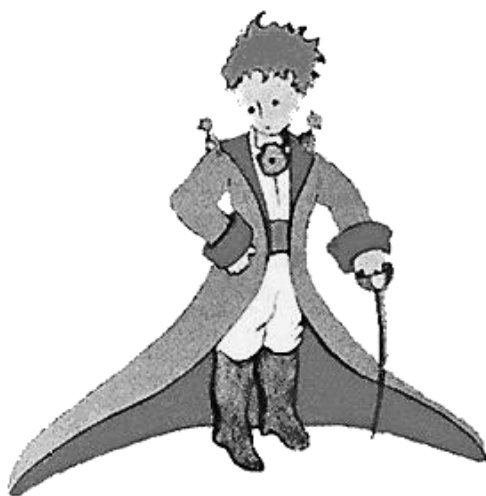
Слика 4. Мали принц

На наредном Егзиперијевом цртежу приказан је Мали принц. „Ево његовог најбољег портрета који сам, касније, успео да нацртам” (Егзипери 1979: 13).