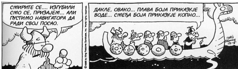
Слика број 1: Географска карта

Слика 6. Географска карта . Да би је користили на терену, карту треба оријентисати, тј. поставити је тако да бочна ивица рама буде усмерена тачно према северу. Данас север одређујемо помоћу компаса или GPS уређаја, а некада, када тих помагала није било, север је одређиван само астрономским методама. Посебно је вештина оријентације била цењена код морепловаца – на отвореном мору обала се не види и нема никаквих оријентира. Зато су спасоносне оријентире морепловци потражили на небеском своду: Сунце дању, а Месец, звезде, сазвежђа и звездане конфигурације, ноћу.