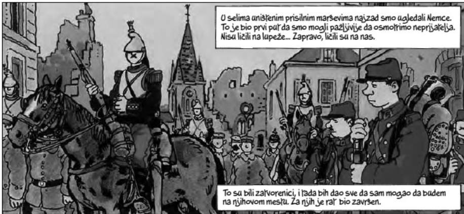
Слика број 3: Странице стрипа Проклети рат

Два велика уметника, Жак Тарди и Жан Пјер Верне 17 су на врло занимљив начин наративно и визуално осликали страхоте Првог светског рата. Проклети рат је велика, сугестивна и емотивна прича у стрипу која Велики рат сагледава са аспекта обичних људи, војника и страдалника којима је он донео само једно – велику трагедију. Ево секвенци које могу послужити у обради теме Први светски рат (четврти разред).